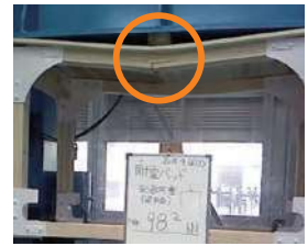
クラック発生荷重 約9.6トン