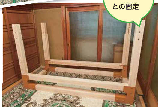
下部接続金具と柱・梁との固定