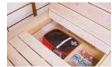
床下非常用備品収納箱