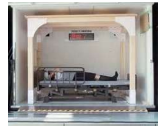
介護ベッド用シェルター

3次元(前後・左右・上下)の地震実験・体験車で、震度7の揺れを15秒間再現。実験後、本体の細部にわたり変形等の異常がないことを確認。