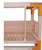
WOOD・LUCK 専用縦型手すり