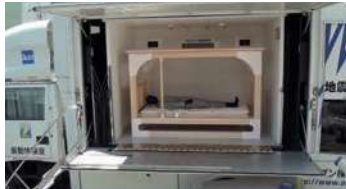
ベッドシェルター